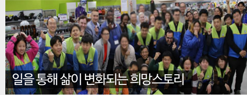
일을 통해 삶이 변화되는 희망스토리